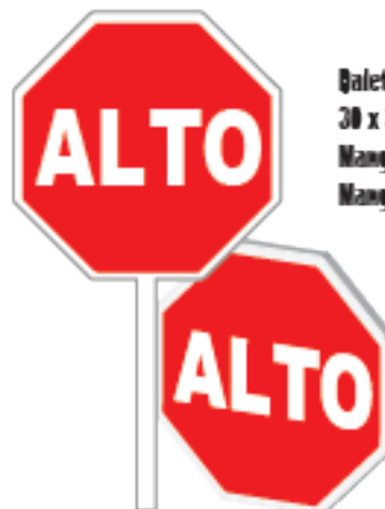
Ñaleta tipo escolar 30 x 30cm Mango ØVC Mango aluminio