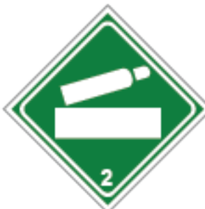
27,5 x 27,5cm