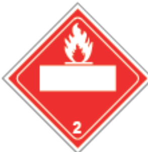
27,5 x 27,5cm