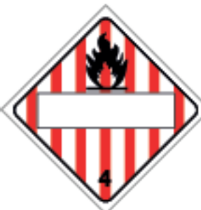
27,5 x 27,5cm