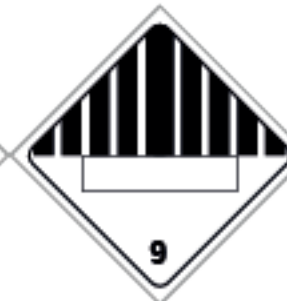
27,5 x 27,5cm