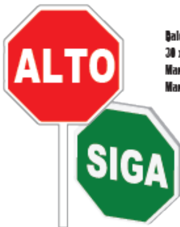
Ñaleta tipo escolar 30 x 30cm Mango ØVC Mango aluminio