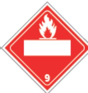
27,5 x 27,5cm