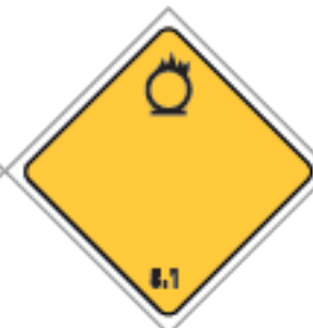
27,5 x 27,5cm