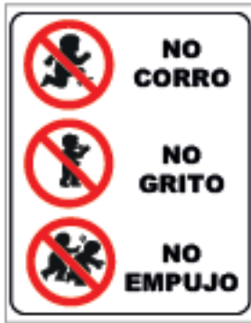
40 x 60cm