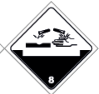
27,5 x 27,5cm