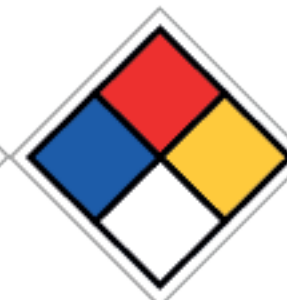
27,5 x 27,5cm